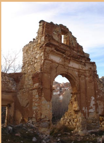
Convento de San Guillermo

Del Convento de San Guillermo , se cuenta en el lugar, que fue el mismo San Guillermo, Duque de Aquitania y de Poitiers (Ducado situado en el sur de Francia) que con otros monjes guerreros, se instaló en una cueva próxima para orar y hacer penitencia. No se tienen más datos hasta el 1210, cuando Pere II, conquista estas tierras y ordena que se amuralle toda la villa. Quizás por entonces comienza la construcción del convento que posteriormente pertenecería a la orden de los agustinos. A lo largo de la historia se reformó