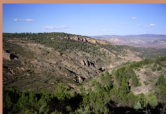
Vista desde la ruta

Los Alcores , territorio agreste constituido por relieves accidentados, que han dado lugar a impresionante cantiles rocosos como los de Los Morrones y Las Hoces, con una espectacular vista desde arriba.