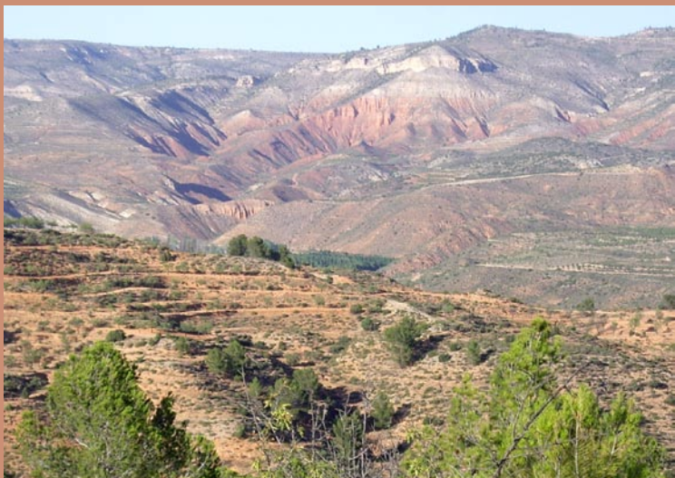
Vista desde la ruta

Km 18 Después de pasar dos desvíos que cogemos a la derecha, llegamos al Barranco del Val del Agua .