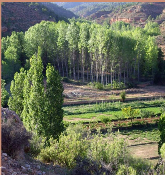
Barranco Val del Agua

Km 31,2 Entramos en El Rato término de Castielfabib.