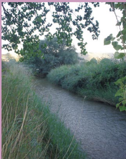
Río Turia a su paso por Ademuz

Km 18,7 Nos encontramos con el puente sobre el río, que cruzamos llegando a la población de Casas Bajas .