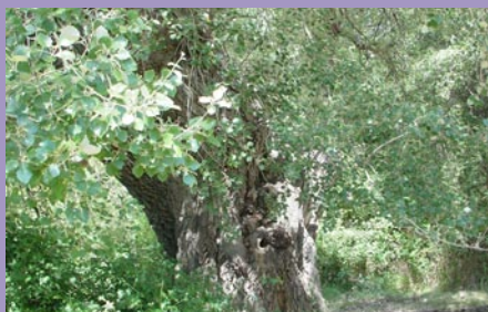
Alamo centenario. Fuente Canalón

Km 25 Pasando por campos de almendros y olivos llegamos al pueblo de Casas Bajas , por los pajares del Barranco del Cerrado.