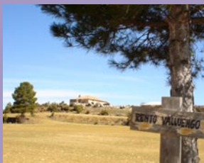
Rento del Vallongo

Km 10,8 Llegamos a lo alto de La Higuera , desde donde descendemos por un camino encontrando las huellas del pasado