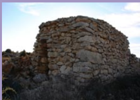
Chozo llano Pinar

lugar donde se coloca la Virgen del Santerón en la romería que se celebra cada siete años y que viniendo desde Vallanca sirve de descanso y merienda de los fieles que siguen esta curiosidad.