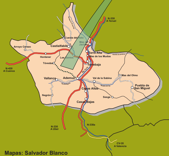
Mapas: Salvador Blanco Dirección del Proyecto: Clara Ros.