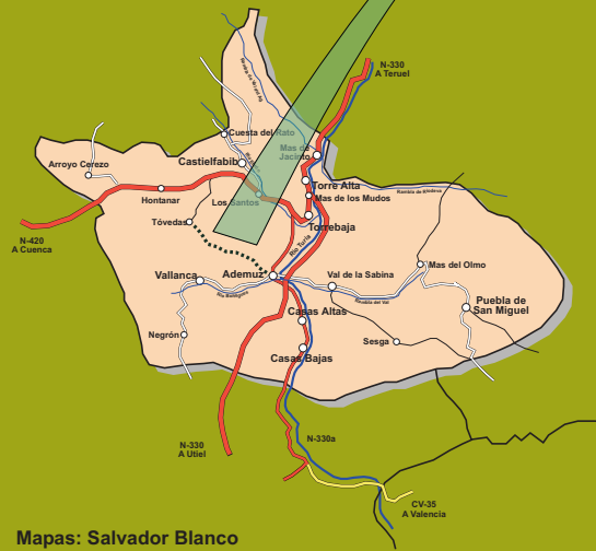
Mapas: Salvador Blanco Dirección del Proyecto: Clara Ros.